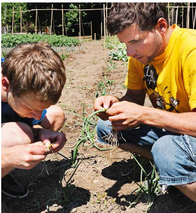
Culture maraîchère, vérification de la qualité de la production.